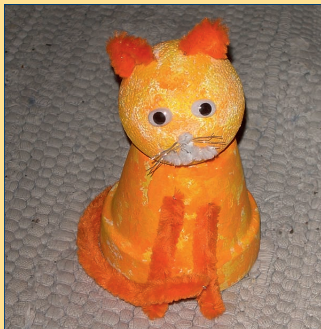
Wichtelgeschenk für Timmi

Aktionsradius eingeschränkt werden. Zum Glück wuchs das Becken wieder gut zusammen – Gott sei Dank – und durch meine